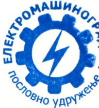
Slobodan Babić, dipl.ing.